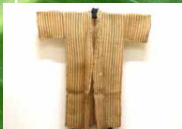
嫁入り道具として 持たされたシルニー

会場：世界遺産座喜味城跡ユンタンザミュージアム2階 企画準備室 開館時間：9:00～18:00（最終入館は17:30） 休館日：水曜日